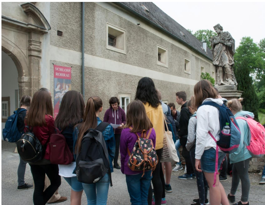
Rohrau – M. és J. Haydn szülőháza