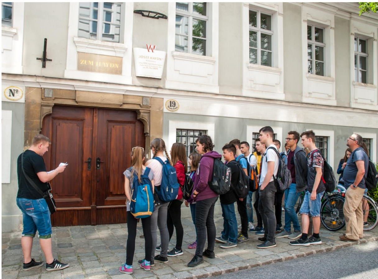
Bécs, J. Haydn lakóháza, ma múzeum.